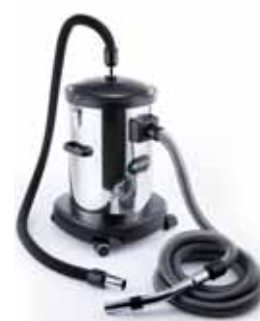
Separatore di ceneri

Il separatore di liquidi viene utilizzato ogniqualvolta si desidera aspirare acqua o liquidi, evitando che finiscano all'interno della rete tubiera.