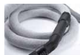
Calza di rivestimento per tubo flessibile