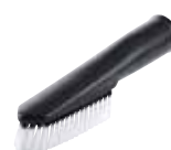
Spazzola con setole per abiti