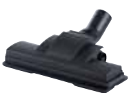
Spazzola per parquet in feltro