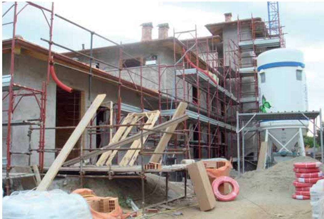
Immagine di un cantiere edile