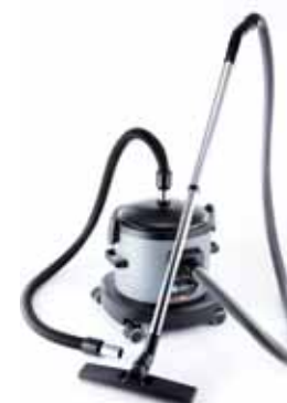
Separatore di liquidi