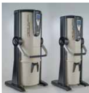
Revo Block Professional

Uffici, strutture sportive, agriturismi, laboratori e centri estetici.