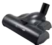
Spazzola turbo battitappeto-moquette