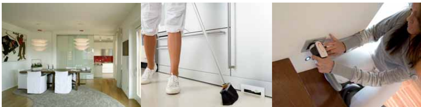
La presa a battiscopa viene installata nello zoccolo del mobile della cucina