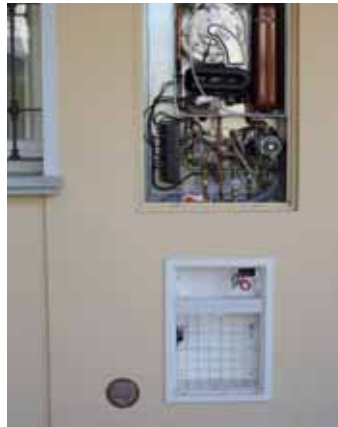
Posizionamento di una contropresa e suo dettaglio