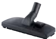
Spazzola doppio uso pavimenti-tappeti