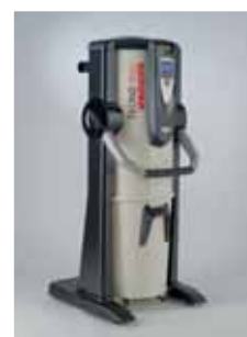
TECNO Star Dual Power