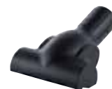
Spazzola turbo battitappezzeria