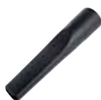
Lancia per angoli