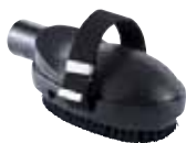
Spazzola per animali